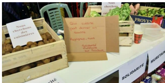
La solidarité muretaine, c'est au quotidien, grâce à quelques bénévoles 29 décembre 2022