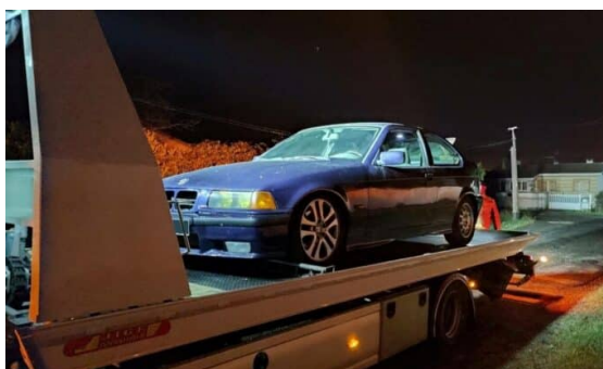
Lutte contre les rodéos urbains à Muret 29 décembre 2022