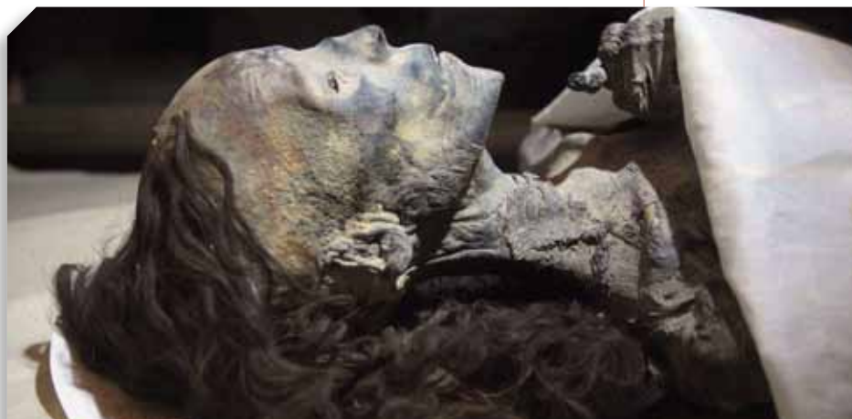
▲ Momie de la reine Tiye, épouse du pharaon Amenhotep III (XIV e siècle avant notre ère).

Ainsi les Hébreux participent-ils à la construction de plusieurs villes-entrepôts dont les noms varient selon les traditions ; on trouve notamment la mention de « Ramsès », diminutif de Pi-Ramsès attesté au I er millénaire avant notre ère, ou encore « Ôn », en grec « Héliopolis » (« ville du soleil »). Ces noms correspondent tous à des villes localisées en Basse Égypte, dans le delta du Nil ; ils précisent ainsi le cadre géographique de notre récit, tout en révélant la multiplicité des traditions qui se sont développées au fil des siècles. L'asservissement imaginé par le