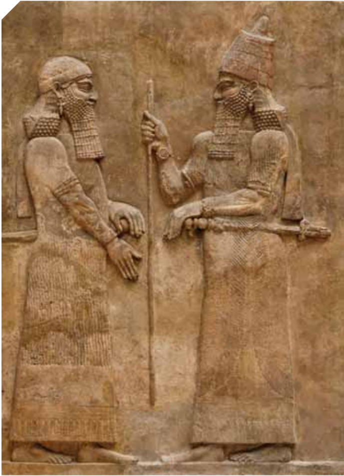
^ Bas-relief représentant, à droite, le roi Sargon II (VIII e siècle avant notre ère) qui a propagé la légende de Sargon. Palais de Dur Sharukin (actuelle Khorsabad, Iraq). Musée du Louvre, AD 19873-19874.

m'enfanta. Elle me mit dans une corbeille de roseau ; avec de l'asphalte, elle ferma l'ouverture. Elle me jeta dans la rivière qui ne m'engloutit pas. Le fleuve me porta et m'emmena vers Aqqi, le puits d'eau. Aqqi, le puits d'eau, me sortit en plongeant son vase. Aqqi, le puits d'eau, me prit comme son fils et m'éleva. Il m'établit comme son jardinier. Alors que