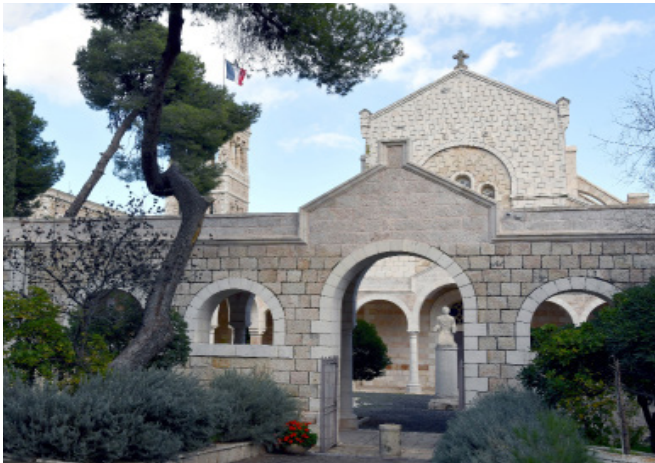
Entrée de l'école biblique et archéologique française de Jérusalem (EBAF).

à l'Académie des Inscriptions et Belles-Lettres